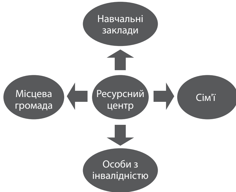
Рис. 1. Модель надання додаткових послуг № 1.

Нижче наводяться дві основні моделі ресурсних центрів. Ці моделі виникли у відповідь на існуючі потреби людей з інвалідністю, сімей дітей з особливими потребами, працівників служб домашнього догляду та підтримки або окремих цільових груп (наприклад, людей з порушеннями зору) (рис. 1, 2).